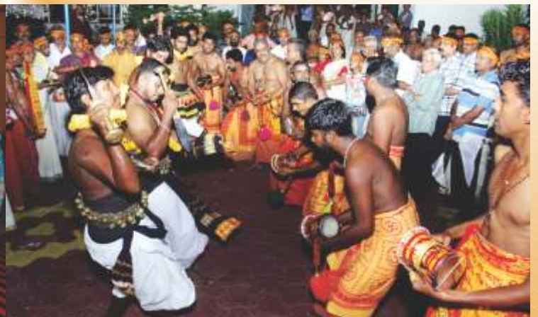
ARTISTS PERFORMING AYYAPPAN VILAKKU.