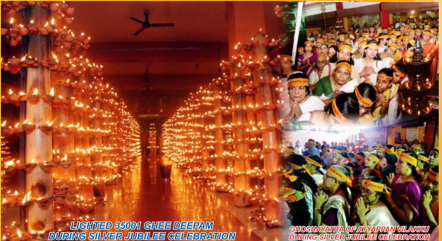
LIGHTED 35001 GHEE DEEPAM DURING SILVER JUBILEE CELEBRATION