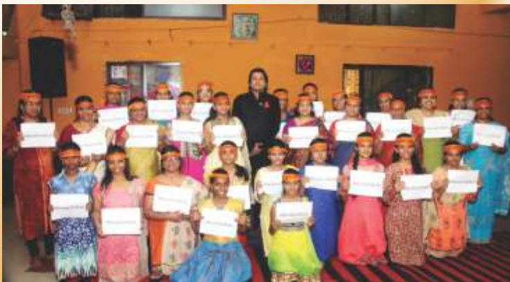
Female Devotees (between 11 to 50 years) pledging in presence of Shri Rahul Iswar for READY-TO-WAIT CAMPAIGN for their entry to Shabarimala shrine.

SRI AYYAPPA MANDIR, SHIVAJI NAGAR, BHOPAL CELEBRATED ITS 25 TH PRATISHTA ANIVERSARY (SILVER JUBILEE) IN A GRAND MANNER FROM 24 TH JUNE 2017 TO 30 TH JUNE 2017, WITH VARIETY OF PROGRAMS VIZ., AYYAPPAN VILAKKU, LIGHTING OF 35001 NEY VILAKKU (GHEE DEEPAM), 2 DAYS RELIGIOUS DISCOURSE BY SHRI RAHUL ISWAR (A RENOWNED ORATOR OF KERALA) AND MAHAANNADANAM WERE ORGANIZED DURING THE CELEBRATION.