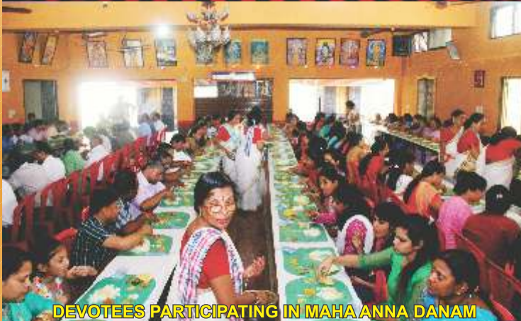
DEVOTEES PARTICIPATING IN MAHA ANNA DANAM